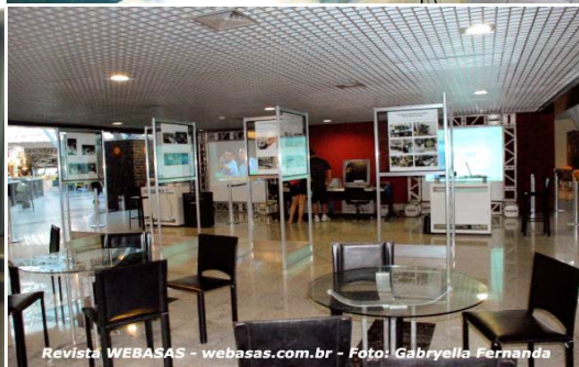
Revista WEBASAS - webasas.com.br - Foto: Gabryella Fernanda