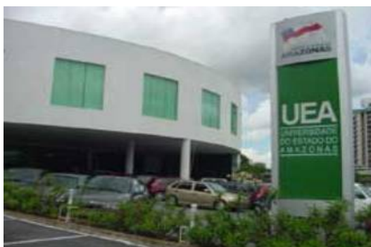
Revista WEBASAS - webasas.com.br - Foto: Gabryella Fernanda